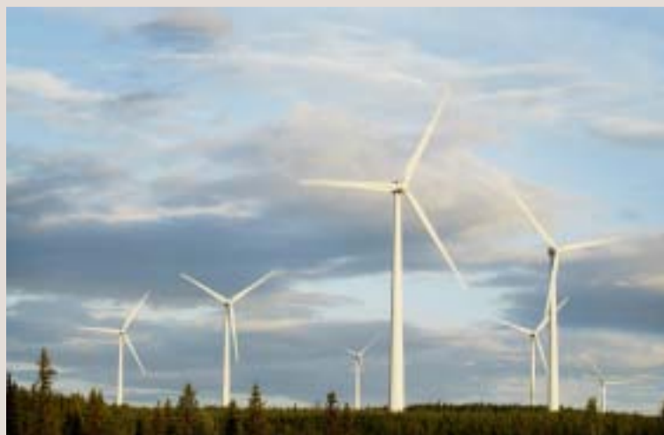
Heretter skal utbygging av vindkraft legges til Sverige, mener flere norske politikere. Her fra Stamåsen vindpark i Nord-Sverige.